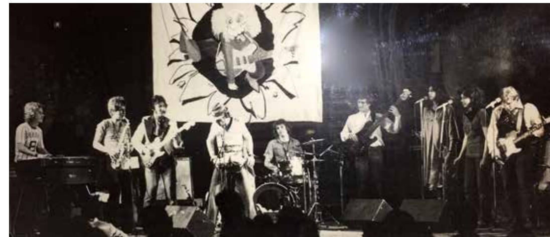
Starfuckers i Saltlageret, 1978.